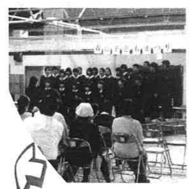
10月10日 青山子どもまつり

あいさつ標語表彰、ポスター優秀作紹介の他、厨中合唱部、青小金管バンド、北梅太鼓の演奏や厨中生の弁論スピーチを実施した