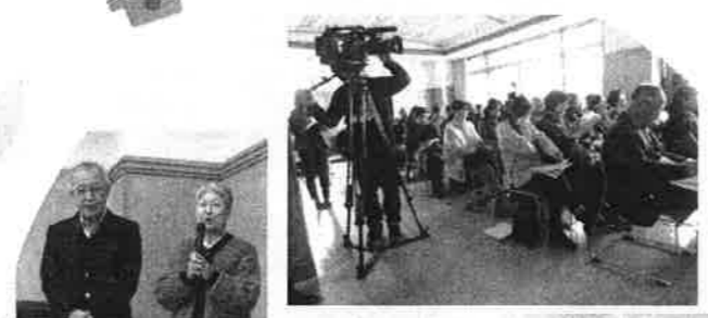
11月26日 認知症への 理解と対応 (詳細 1p)