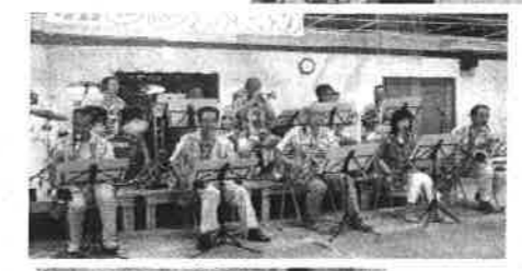
6月13日 赤レンガまつり 快晴に恵まれ大成功(2つ進む)